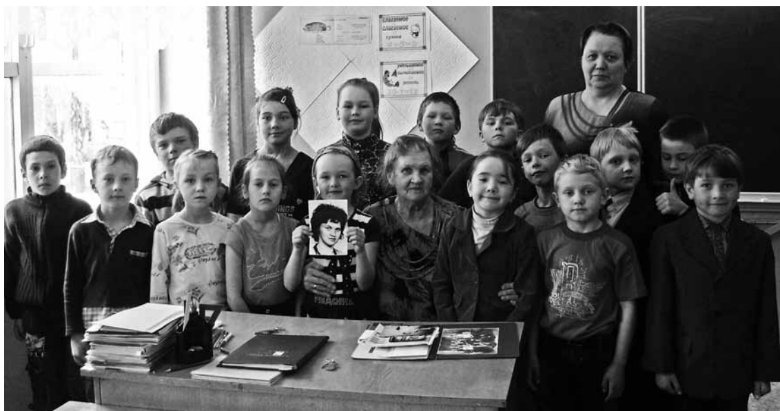
Встреча в Куркиёвской школе.

Закончилась война, объявили победу... Одни