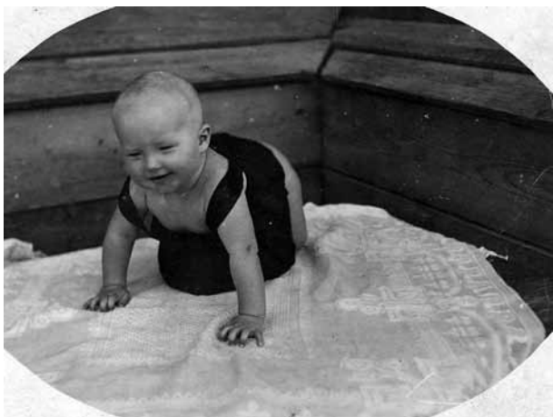
Эльза. 7 месяцев.

Сколько лет прошло со времени начала Вели-