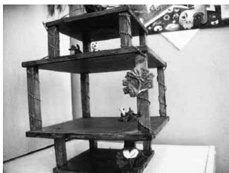
София Бузеева 1В