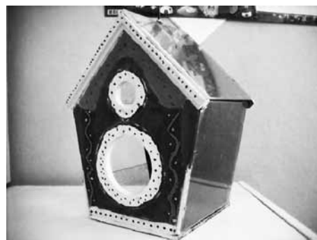
Артур Багдасарян 1В