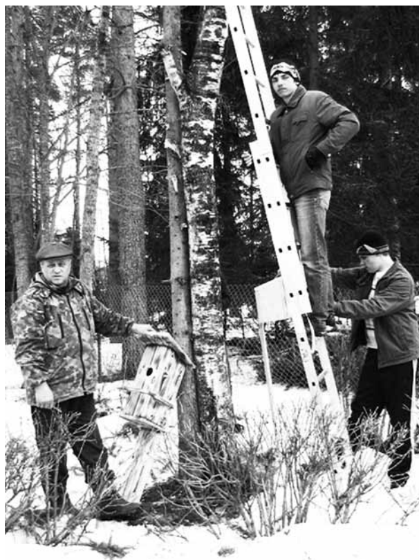
Скворцы! Добро пожаловать в Элисенваара!

6 апреля для отделения временного пребывания пожилых людей п Куркиёки была приобретена мебель: 4 комода для комнат пациентов.