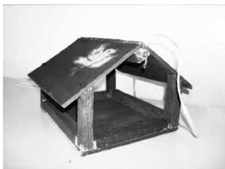
Максим Лежнин 1Б