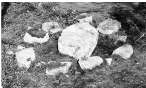
Здесь собирались валиты

В начале нашего века любознательные путешественники обратили внимание на интересное каменное сооружение, расположенное на острове. Это был большой каменный стол, окруженный девятью каменными стульями. Капитан катамарана Игорь Виговский прислал фотографии в Куркиёкский краеведческий центр. Это оказался легендарный «стол совета» древних карелов. За такими столами собирались карельские старейшины-валиты в XII-XIV веках.